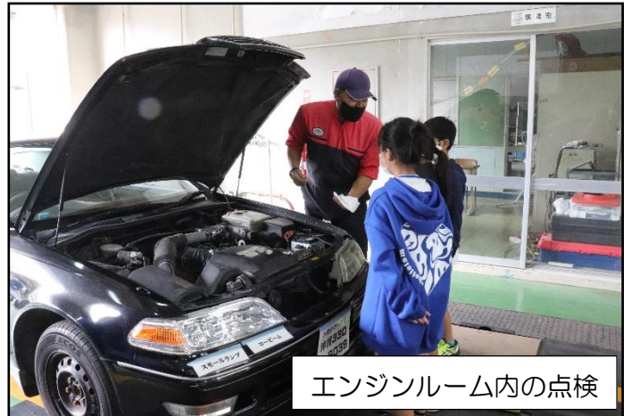
エンジンルーム内の点検