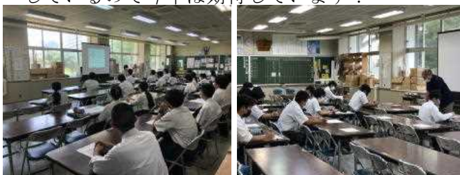
〈志望動機の書き方講座〉

7月25日から、8月26日まで夏休みパワーアップセミナーが実施されました。今後、本格化する就職・進学活動に向けて生徒1人1人の力をパワーアップするため、外部講師及び全職員で実施している取組です。就職は面接の練習や志願書・履歴書の書き方、進学は小論文対策等、それぞれにあったプログラムを実施しています。参加している生徒はどの生徒も真剣に取り組んでいました。昨年より参加率もアップしているので今年は期待しています！