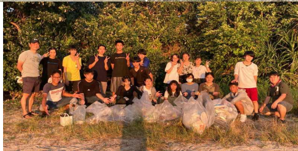
生徒会のみなさんお疲れ様でした！