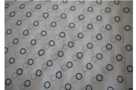
(3) ドット×サーターアングギー