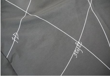
(1) FD style