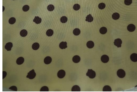
(2) ドット×サーターアングギー